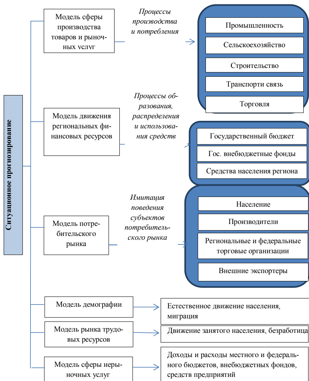
Рис. 2. Модели ситуационного прогнозирования в региональной экономике

После того, как все модели построены и количественно описаны, возможно применение общей модели региона на глубину прогнозируемого периода по заданному сценарию и выдаются результаты прогнозирования в виде пакета прогнозных документов по всем показателям социально-экономического развития.