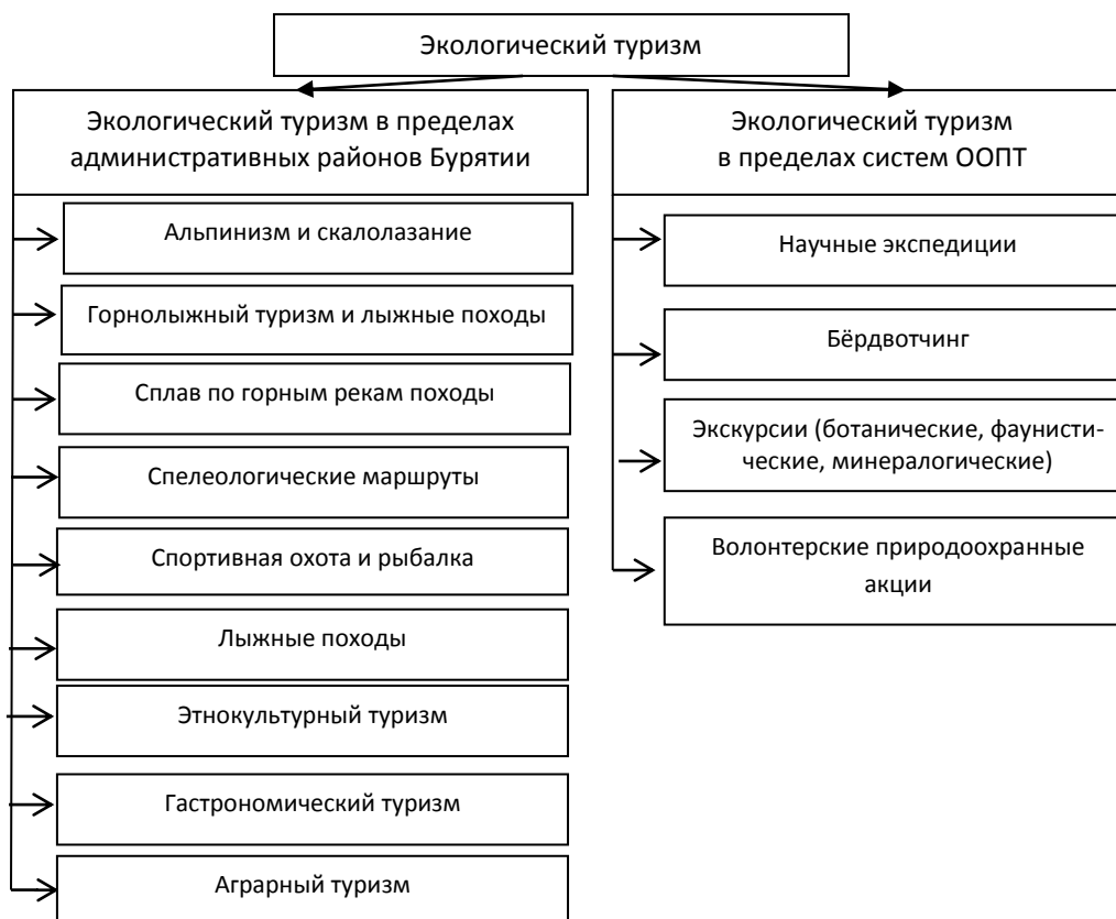
Рис. 2. Виды экологического туризма в Республике Бурятия

Виды экологического туризма в пределах административных районов и систем ООПТ в Республике Бурятия показаны на рис.2.