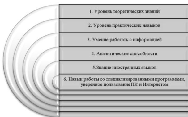
Рис. 1. Качества, формирующие профессиональную компетенцию

Каждая из групп компетенций состоит из набора качеств, которые в наибольшей степени отражают ее содержание. Так, профессиональная компетенция должна отражать в наибольшей степени квалификационный уровень выпускника вуза, т. е. уровень теоретических знаний, соответствующих учебным планам вуза, которые включают общетеоретическую подготовку, знание иностранного языка, умение работать на ПК, в том числе с профессиональными программами. Важным качеством являются сформированные практические навыки как результат организации различных видов практик. Перечисленные выше качества формируются учебным планом вуза. Кроме того, мы считаем, что для достижения конкурентоспособности у выпускника начиная со школы должны формироваться аналитические способности и прививаться навыки работы с информацией, которые в дальнейшем совершенствуются в процессе обучения в вузе. Именно эти два качества зачастую слабо развиты у выпускников школ, а вуз не всегда успевает дать им должное развитие, тогда как для работодателя эти качества играют не последнюю роль. На рисунке 1 представлены качества, которые, по нашему мнению, формируют профессиональную компетенцию [12].