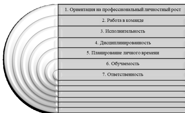
Рис. 2. Качества, формирующие личностную компетенцию

Все представленные качества, за исключением «обучаемости», формируются институтами, с которыми связан процесс формирования личности — семья, дошкольные учреждения, школа, вуз и т. п., т. е. средой, воспитывающей данную личность. Лишь «обучаемость» является врожденным качеством и уже на старте предполагает разные возможности.