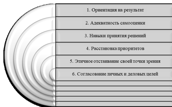
Рис. 3. Качества, формирующие деловую компетенцию

Качества, представленные на рисунках в определенной последовательности, не предполагают соответствующую значимость каждого. Социологический опрос показал, что работодатели по-разному ранжируют данные качества в соответствии со своим представлением об их влиянии на конкурентоспособность выпускников.