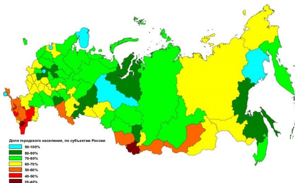
Рис. 2. Урбанизация по субъектам Российской Федерации за 2018 г.

Так, например, для развития сельского хозяйства необходимо создание механизмов развития организационно-хозяйственной инфраструктуры сельского хозяйства на региональном уровне, а именно создание вертикальных и горизонтальных связей, кооперативов в сельском хозяйстве, фермерских рынков. А вот государственное регулирование и участие в развитии сельского хозяйства обеспечивать за счет программ и проектов [2].