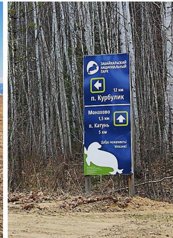
Рис. 5. Развилка на Катунь-Курбулик и Монахово.