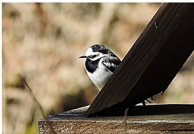
Рис. 7. Белая трясогузка на деревянном настиле у термального источника (27.05.2019 г.,).