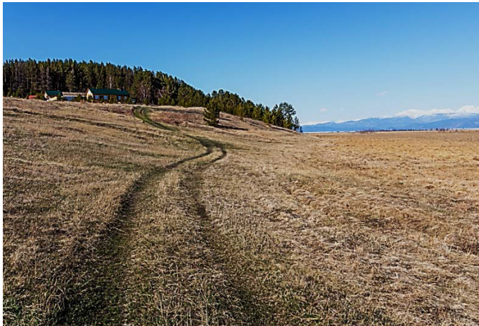
Рис. 4. Проселочная дорога к туристско-гостиничному комплексу «Кулиное» (2016).