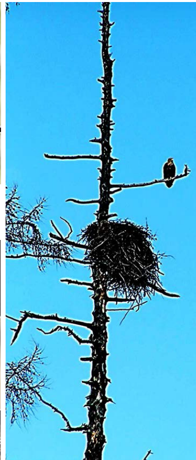
Рис. 8. Орлан-белохвост у гнезда.