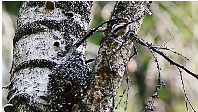
Рис. 6. Строящееся гнездо ополовника в березняке; ополовник справа от гнезда (23.05.2019 г.,).