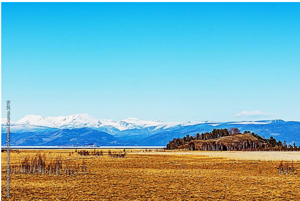
Рис. 3. Возвышенность «Коврижка» у юго-западного побережья Чивыркуйского залива.