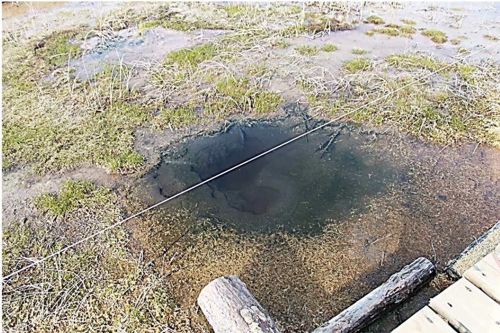
Рис. 2. Один из грифонов термального источника (21.05.2019 г.,).