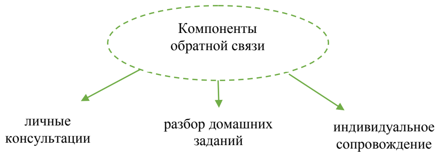
Рис. 2. Компоненты обратной связи

Составляющие компоненты обратной связи представлены на рис. 2.