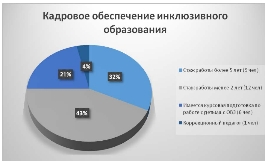
Рис. 2. Анализ кадрового обеспечения инклюзивного образования в ДОУ

Проблема кадрового обеспечения также связана и с тем, что в саду всего 9 педагогов из 21 имеют стаж работы в образовательном учреждении более 5 лет, а большая часть — 12 педагогов менее 2 лет и всего у 6 педагогов имеется курсовая подготовка по работе с детьми с ограниченными возможностями здоровья. Кроме этого, из коррекционных педагогов, которые могли бы оказывать детям с ОВЗ и их родителям квалифицированную помощь в детском саду только один учитель-логопед, что свидетельствует о нехватке квалифицированных кадров, для большей наглядности эти данные представлены в следующей диаграмме (рис. 2).