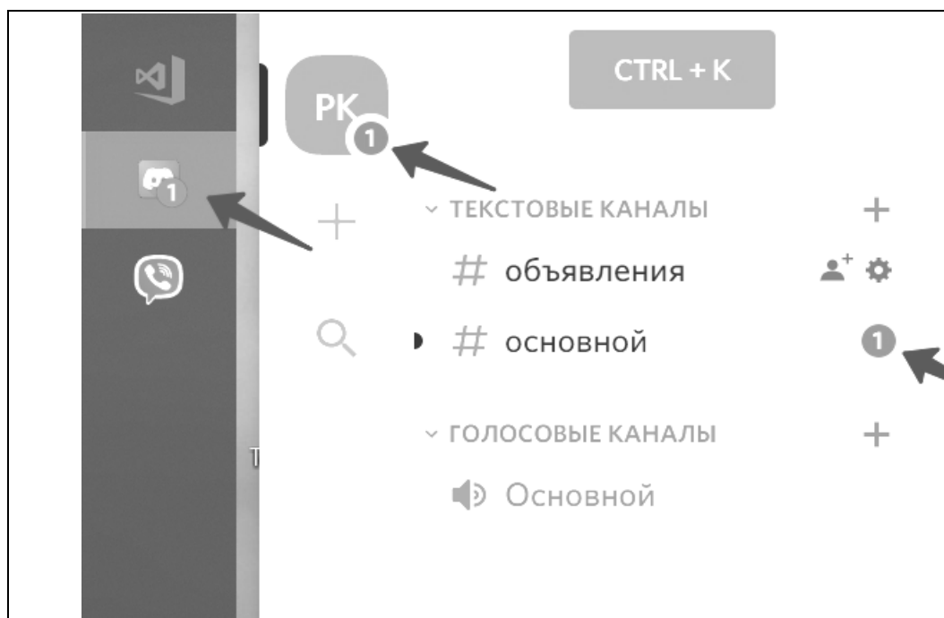
Рис. 3. Пример обозначения упоминания пользователя

Благодаря такому отображению уведомлений о новых сообщениях, можно будет эффективно уведомить ученика о важной информации, а если информация незначительная, то он может не обращать внимание и не тратить время на то, чтобы прочитать всё.