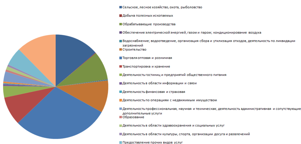
Рис. 1. Удельные веса занятых в неформальном секторе по видам экономической деятельности за 2018 год в Российской Федерации 1

По данным органов государственной статистики, наибольшее число неформально занятых граждан по видам экономической деятельности преобладает в оптовой, розничной торговле (33,8%), на втором месте сельское хозяйство (15,5%), а третье место строительство (11,4%) (рис. 1).