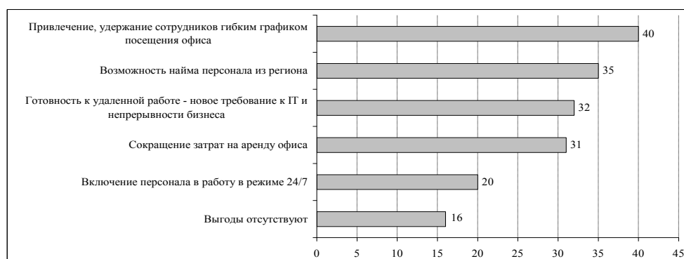
Рис. 1. Выгоды от дистанционной (удаленной) работы по результатам обследования предприятий основных секторов экономики России по итогам работы в 2020 г., % обследованных предприятий 2

В рамках масштабного исследования принципов организации удаленной работы российским бизнесом в 2020 г. было установлено, что 84% компаний находят преимущества как для бизнеса, так и для сотрудников (рис. 1). Тема самым повышается привлекательность дачных поселков как места постоянного жительства и выполнения трудовой функции, причем как в рамках крупного города, так и регионов.