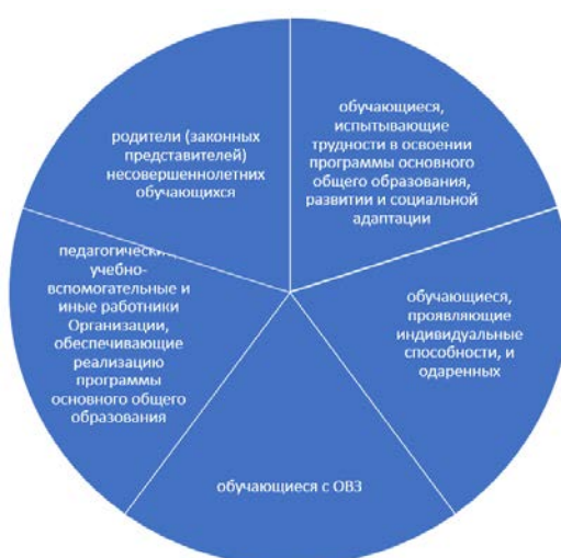
Рис. 3. Индивидуальное психолого-педагогическое сопровождение всех участников

В числе субъектов сопровождения значатся родители и законные представители учащихся (рис. 3).