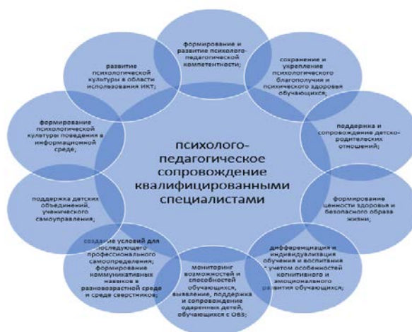
Рис. 4. Содержание психолого-педагогического сопровождения

Приведем определение категорий семей для организации психолого-педагогического сопровождения семей, воспитывающих детей и подростков, имеющих психолого-педагогические проблемы: