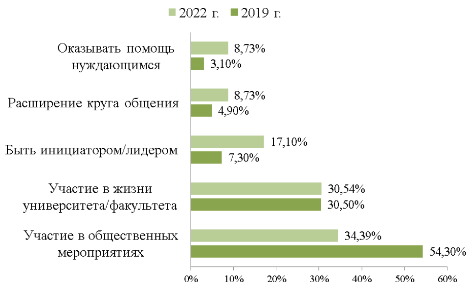
Рис. 1. Распределение ответов респондентов о характеристике понятия «социальная активность»

В ходе исследования 2019 г. были получены следующие результаты. По мнению большинства опрошенных студентов (54,30%), наиболее подходящим вариантом, отражающим основную идею социальной активности, является «участие в общественных мероприятиях» (рис. 1). По результатам опроса 2022 г., у данного варианта ответа показатель набрал 34,39% голосов респондентов.