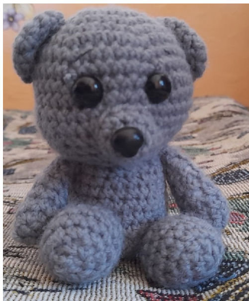
Рис. 2. Вязаная игрушка

Самыми сложными изделиями, связанными школьниками в ходе исследования, будут объемные игрушки. Здесь помимо определения цветовых сочетаний и предпочтений форма изделия в целом и его отдельных частей должна включать объемное видение предмета, а также изучение стилистических особенностей его внешнего вида.