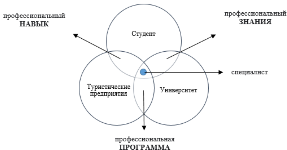
Рис. 2. Обучение на рабочем месте

Заключение. В последние годы причиной отсутствия повышения результатов обучения в сфере туризма является практическое обучение. Неспособность университета удовлетворить потребности работодателей так или иначе связана с учебной программой.