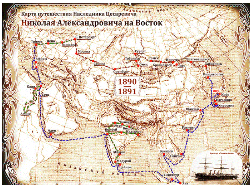
Рис. 1. Карта путешествия наследника цесаревича Николая Александровича на Восток

И. Т. Изыкенова. Образ Николая II в формировании государственной идентичности и ментальности в условиях музейной и памятниковедческой среды