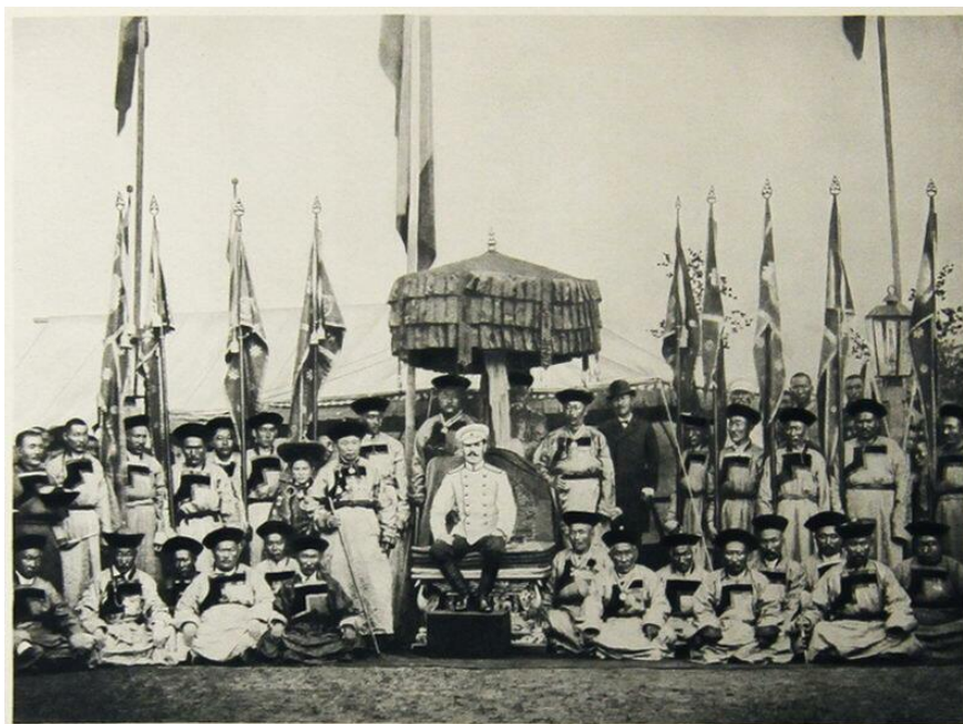
Рис. 3. Цесаревич Николай Романов. Встреча с представителями бурятских родов. 1891 г. Забайкалье

Необходимо отметить, что к встрече цесаревича готовились все сообщества граждан Российской империи по его пути в Санкт-Петербург, что стало свидетельством единения власти и народа на востоке страны: главы бурятских родов собрались в Ацагатском (Шулутском) дацане, в Верхнеудинске именитые горожане встречали в доме купца И. Ф. Голдобина, простые жители — на улице Большой. Здесь уместно отметить, что по статистическим данным в Верхнеудинске в это время проживало 5 184 чел. 1 (табл. 1).