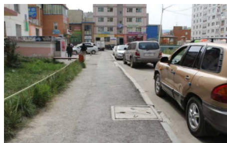
Рис. 2. Старые многоэтажные дома

Район Хан-Уул, 11-й хороо, Ривер-гарден квартал, торгово-сервисная улица является образцом нового стиля жизни для обеспеченных граждан в Улан-Баторе. Жители столицы Монголии в зависимости от типа жилья и отдаленности от центра города имеют разное качество жизни. Поэтому мы считаем, что сравнивать индекс качества жизни нужно по параметрам социально-экономического развития страны, уровню урбанизации и плотности населения.