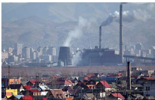
Рис. 1. Юрточный район и смог в Улаанбаатаре

С началом холодного сезона резко возрастает загрязнение атмосферного воздуха, а распространение инфекционных заболеваний становится все более частым явлением. Из-за смога не только в юрточных районах, но и в центре города проблема ослабленного иммунитета и подверженности простудным заболеваниям и гриппу среди детей раннего возраста стала практически обыденным явлением.