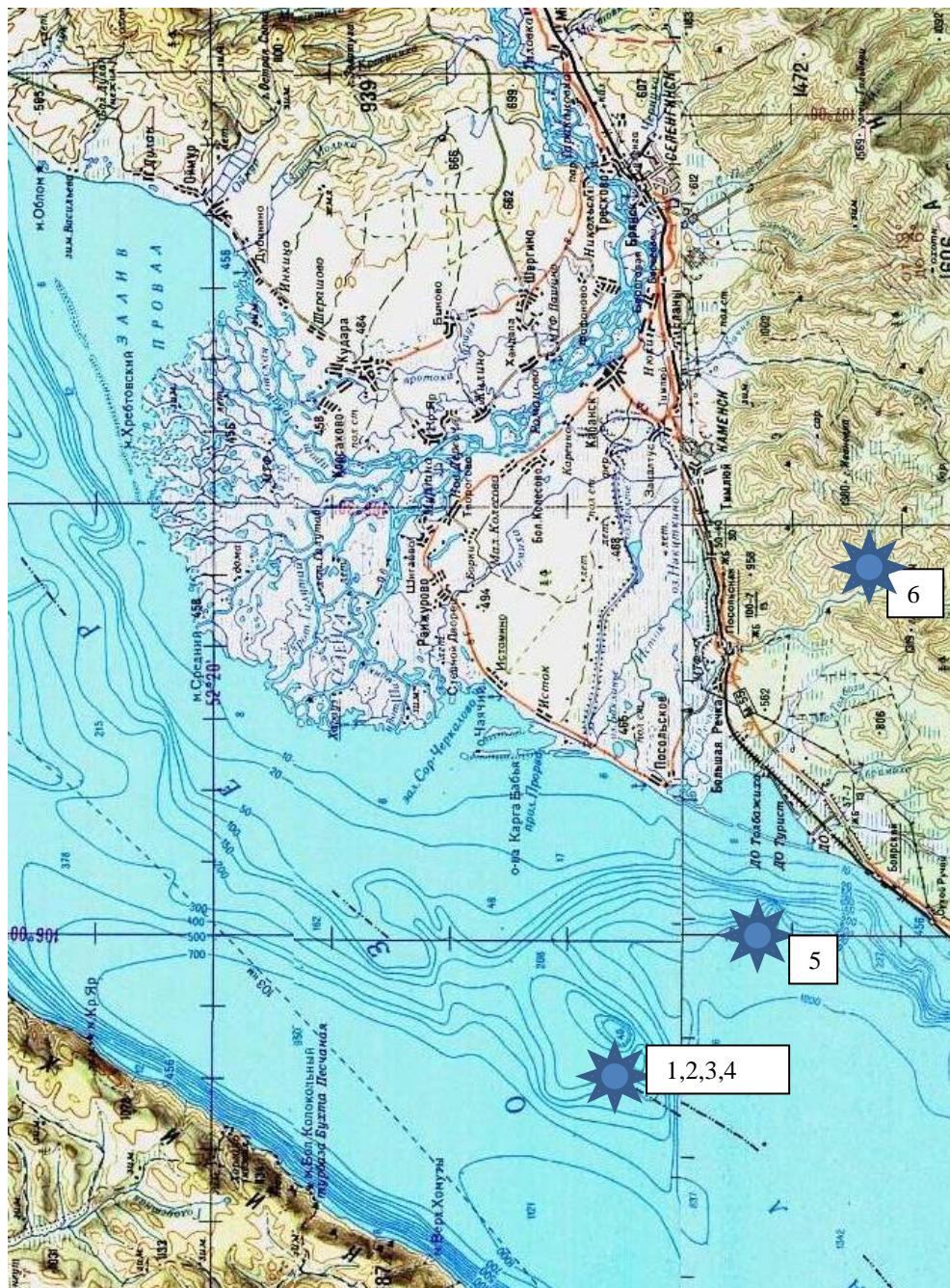
Рис. 3. Схема размещения учреждений отдыха на восточном побережье Южного Байкала (Селенгинское Подморье) (Масштаб 1:100000)