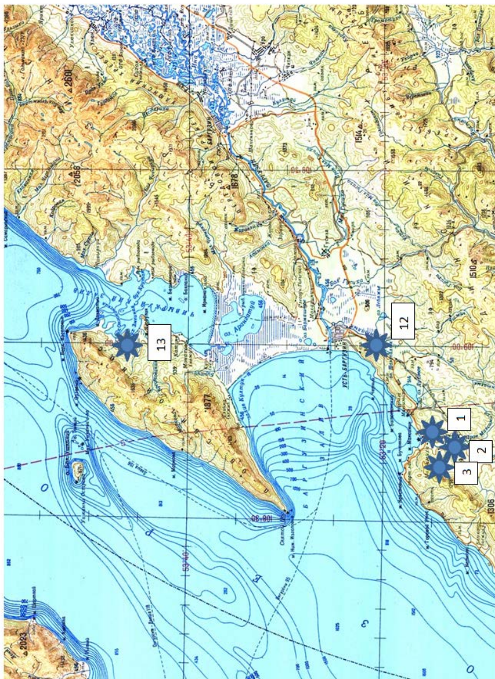
Рис. 1. Схема размещения учреждений отдыха на восточном побережье Среднего Байкала (Баргузинское Подлеморье) (Масштаб 1:100000)