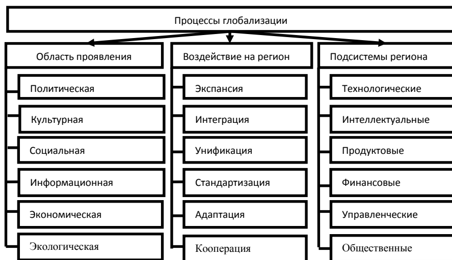
Рис. 1. Воздействие глобализации на развитие социально-экономических систем региона

Воздействие глобализации в первую очередь ощущают следующие подсистемы социально-экономической системы региона: