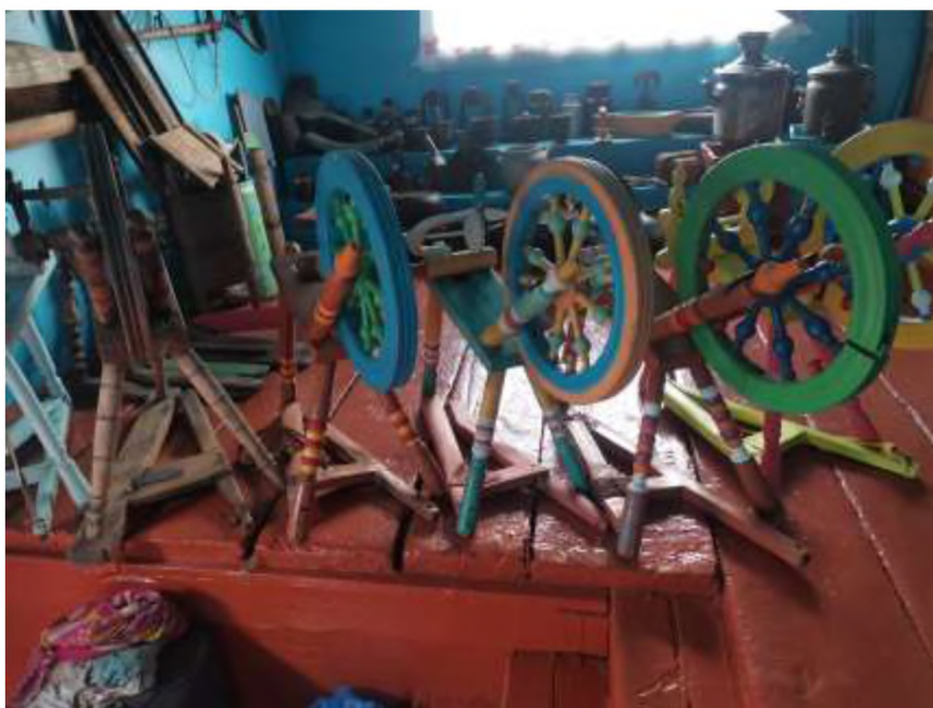
Село Шаралдай. Самопрялки семейских в экспозиции дома Музея-усадьбы Исаия Калашникова. Июль 2024 г.