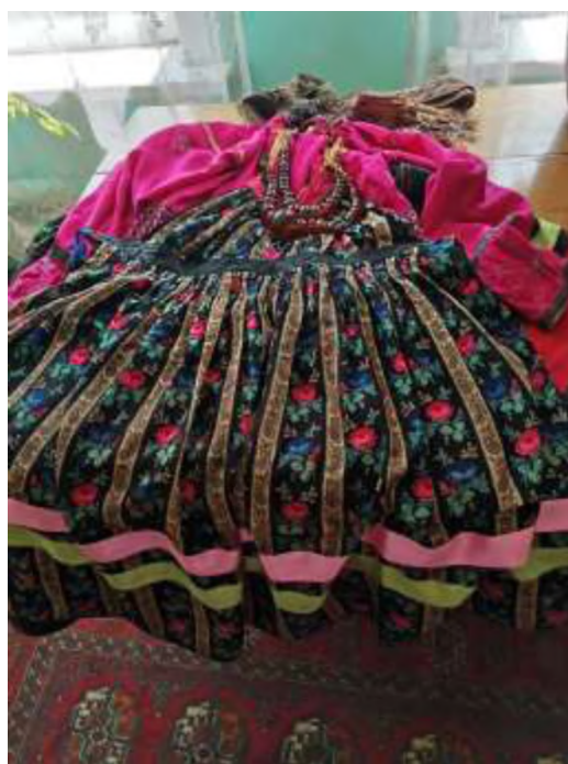
Село Новый Заган. Старинный семейский костюм В. М. Леоновой. Июль 2024 г.