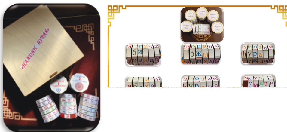
Рис. 4. «Хурдан ухаан» наадан

Зорилго: 2 үзэгүүдһээ эхилээд 6 үзэгүүдтэй ямаршые үгэнүүдые буряад хэлэн дээрэ суглуулха, олохо. Эдэ тараһан, хоорондоо холбоогүй олон үзэгүүд соо хоргодоһон үгэнүүдые олохо. Үгэнүүд зүүн талаһаа баруун тээшээ байгуулагдаха ёһотой. Доро үгтэһэн фотозураг анхарагты.