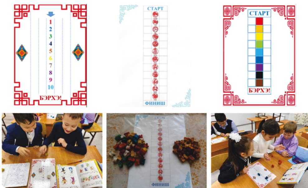
Рис. 2. «Нааданай талмай» наада хэшээлдэ хэрэглэлгэ

«Үнгэ» гэжэ хэшээлэй сэдэбээр 2-дохи ангиин һурагшадай мэдэсээ шалгалгын, бэхижүүлгын үсын гэрэл-зурагуудые дурадханабди.