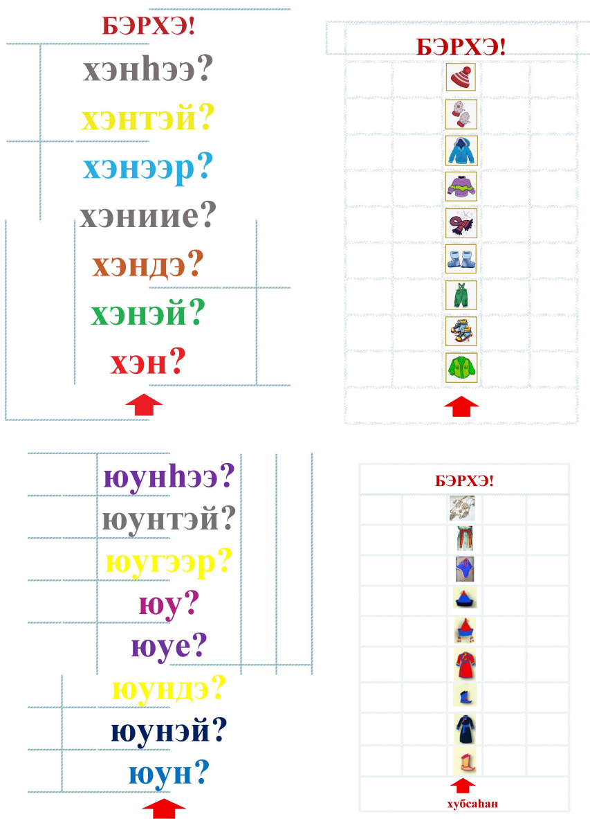
Рис. 1. «Нааданай талмай» наадан

«Мори урилдаан» гэхэн шагай нааданай гуримаар урилдуулжа наадхуулхадаа, үгэнүүдээ дабтанабди, зүбөөр хэлэжэ һурганабди, үхибүүд бэе бэеэ шагнажа, шалгажа, зүб тээшэнь болгонод.