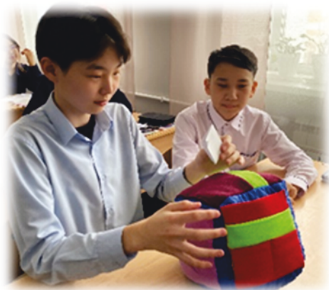
Рис. 3. «Тэбхээнсэг» хэрэглэлгэ

«Эгээ бэрхэ хэн бэ?» гэнэн сэдэбээр хэшээлэй хэнэг үгтэнхэй. Һурагшад тэбхээнсэг хэрэглэжэ, даабари дүүргэжэ байна.