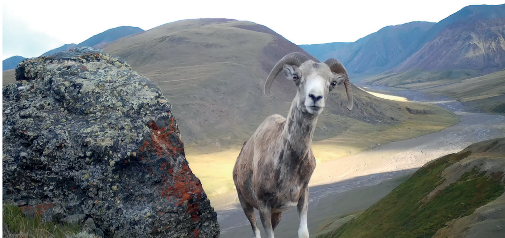
Рис. 1. Одиночная особь архара, хр. Сайлюгем, 23.06.2025 г.