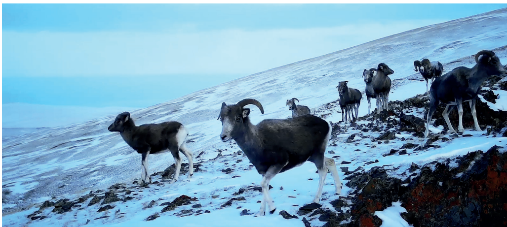
Рис. 2. Группировка архаров на г. Пик Журналистов, хр. Сайлюгем, 14.01.2025 г.