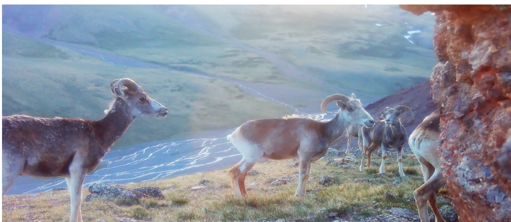
Рис. 3. Группировка архаров в истоках р. Саржематы, хр. Сайлюгем, 31.07.2023 г.