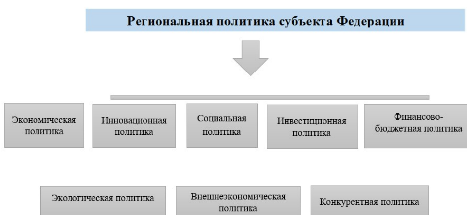
Рис. 3. Направления региональной политики субъекта Российской Федерации [8]

Структура региональной политики представляет собой многоаспектную систему, включающую экономический, инновационный, социальный, инвестиционный, конкурентный, финансово-бюджетный, экологический и внешнеэкономический векторы.