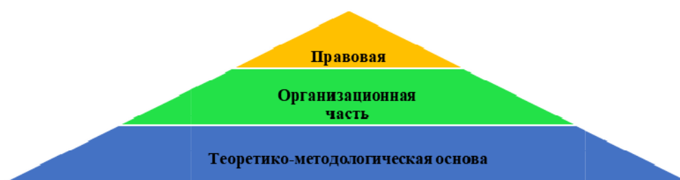
Рис. 4. Пирамида механизма государственного управления.

1. Инструменты прямого действия характеризуются императивным влиянием на объекты управления. К ним относятся законодательные и административные акты, обеспечивающие непосредственное регулирование государственной собственности и управление предприятиями госсектора. Данная группа также включает прямые бюджетные ассигнования: дотационные выплаты, трансферты и целевые расходы на социальную защиту населения.