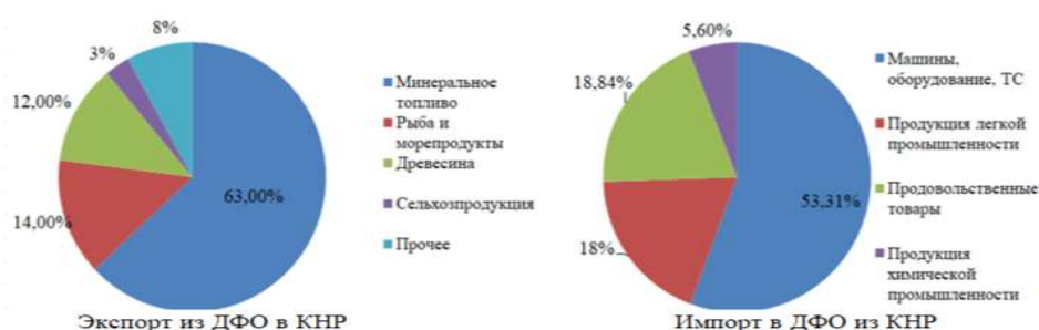
Рис. 2. Внешнеторговая деятельность ДФО и КНР за 2024 г., в % 1

С точки зрения ресурсного потенциала Дальний Восток в Китае называют «Сокровищницей ресурсов», поскольку обладает более 50% лесных ресурсов, 37% пресноводных ресурсов, 27% запасов природного газа, 81% алмазов и около 17% запасов нефти в АТР. Это также важная зона распространения угля, оловянной руды и полиметаллических полезных ископаемых в мире. Это преимущество в ресурсах соответствует стабильному спросу на энергию и сырье в экономическом развитии Китая [3].